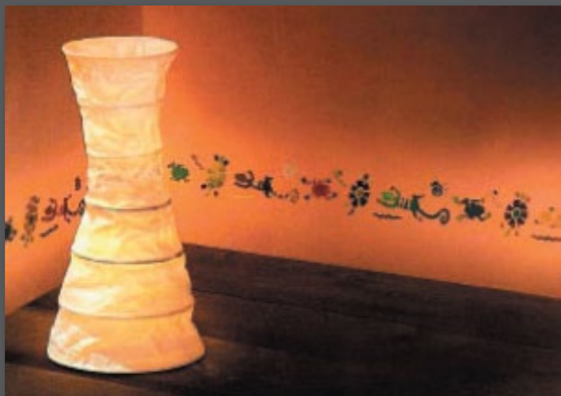
USTVARITE OZRAČJE, OBLIKUJTE PROSTOR TER GA POUDARITE - vse to preprosto in samostojno z izdelki COLOR CREATIVE